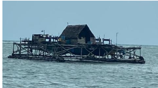
Gambar 6. Kelong Apung Perahu

Tradisional yang digunakan masyarakat yang bermata pencarian sebagai nelayan untuk menangkap ikan dan hasil laut lainnya