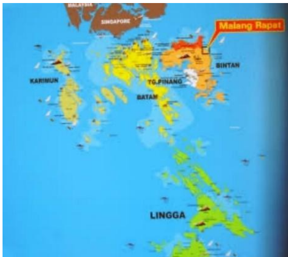
Gambar 1. Peta Kepulauan Riau

Sejarah Pulau Pucung Desa Malang Rapat Kecamatan Gunung Kijang Kabupaten Bintan Provinsi Kepulauan Riau. Desa Malang Rapat merupakan desa yang terletak di kecamatan Gunung Kijang Kabupaten Bintan Provinsi Kepulauan Riau. Kata Malang Rapat diambil dari kata Malang Dan Rapat. Kata Malang merupakan nama pulau yang banyak batunya disepanjang pinggiran pantai. Batu batu ini ada yang ditumbuhi pepohonan dan ada yang tidak. Pada saat air laut sedang pasang surut kelihatan keindahan alamnya karena jarak antar satu pulau dengan lainnya sangat rapat sehingga desa ini disebut Desa Malang Rapat