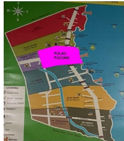
Gambar 3. Peta Pulau Pucung