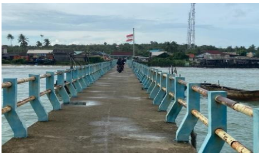
Gambar 4. Dermaga Nelayan