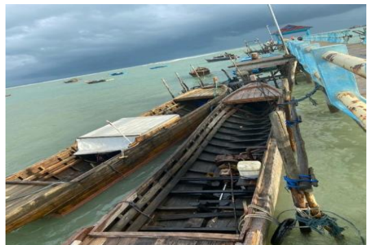
Gambar 7. Perahu Nelayan

Tradisional yang digunakan masyarakat yang bermata pencarian sebagai nelayan untuk menangkap ikan dan hasil laut lainnya