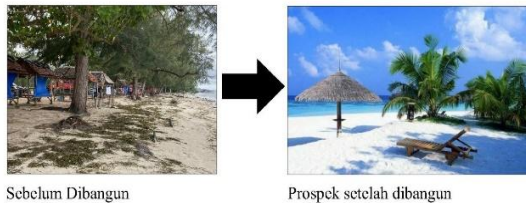
Gambar 9. Pantai dan perencanaannya

Dalam era otonomi daerah, sektor pariwisata memegang peranan penting dalam menunjang perekonomian karena memiliki keterkaitan sebagai sumber percepatan pertumbuhan ekonomi daerah. Pengembangan pariwisata yang berbasis sumber daya dan kearifan lokal ini akan memberikan efek ganda terhadap sektor ekonomi lainnya melalui peningkatan nilai tambah dan kenaikan pendapatan masyarakat. Peningkatan intensitas pemakaian tenaga kerja dalam pengembangan pariwisata tidak hanya diharapkan dapat meningkatkan pendapatan masyarakat, tetapi juga mampu menciptakan kesempatan kerja dan mengurangi tingkat kemiskinan. Pengembangan potensi wisata merupakan bagian dari Pembangunan daerah dan pembangunan nasional untuk mendukung pembangunan berkelanjutan. Sebagai destinasi wisata yang memiliki keragaman daya tarik wisata khususnya Pulau Pucung Desa Malang Rapat.