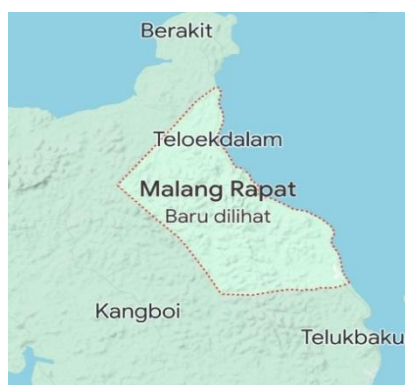
Gambar 2. Peta Desa Malang Rapat