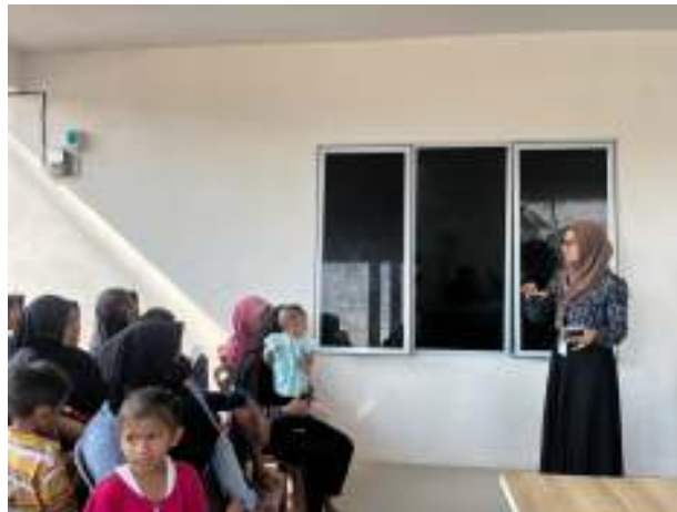
Gambar 2. Pemberian materi