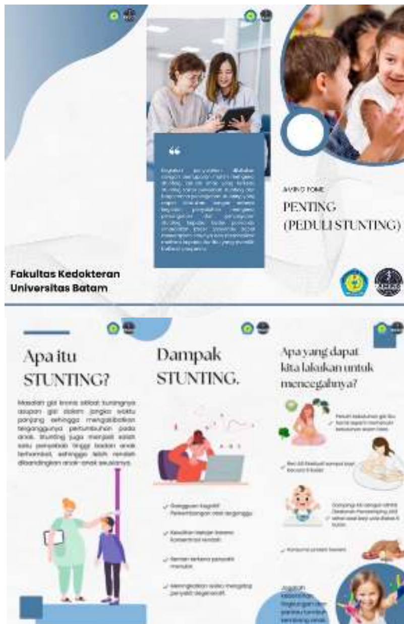
Gambar 4. Leaflet Edukasi

Pelaksanaan kegiatan sosialisasi dan edukasi stunting juga menggunakan media leaflet . Materi yang terdapat didalam leaflet meliputi materi seputar stunting dari apa itu stunting, dampak stunting, pencegahan dan penanganan stunting meliputi sosialisasi pola makan, gizi seimbang, pola asuh orang tua, pemberian ASI, dan perbaikan sanitasi.