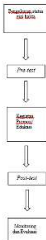
Gambar 0.1 Tahapan Kegiatan Pengabdian kepada Masyarakat

Tahapan kegiatan pengabdian kepada masyarakat sebagai berikut: