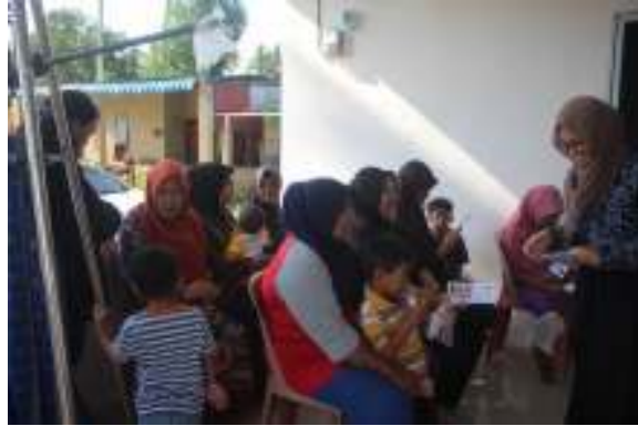
Gambar 1. Pelaksanaan kegiatan sosialisasi dan edukasi stunting