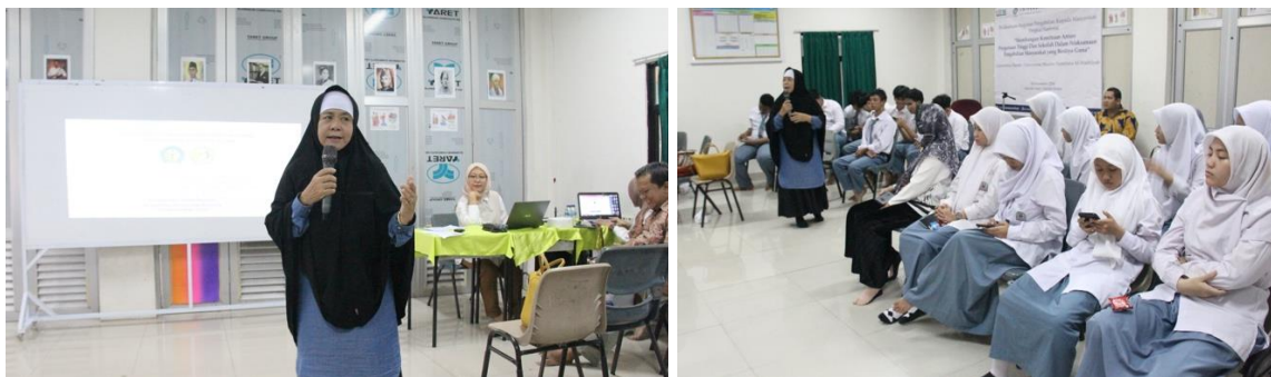
Gambar 4. Pemaparan Materi Tim Kelompok 8

Untuk mengukur sejauh mana peserta memahami materi yang telah disampaikan, serta mengetahui efektivitas dari pemahaman yang diperoleh, dilakukan tes awal berupa pertanyaan sederhana dengan 2 pertanyaan. Hasil menunjukkan adanya peningkatan signifikan dalam pemanfaatan media sosial oleh peserta. Sebelum diberikan materi, skor rata-rata pemanfaatan media sosial peserta adalah 50% sementara setelah materi diberikan, skor rata-rata meningkat menjadi 80%. Peningkatan ini menandakan bahwa materi yang disampaikan berhasil meningkatkan pemahaman dan keterampilan peserta dalam menggunakan media sosial. Dari pertanyaan yang dijawab oleh peserta, terlihat bahwa mereka secara umum memahami materi yang diberikan. Peserta juga menilai bahwa materi tersebut sangat relevan dan penting untuk menghadapi tantangan di masa depan, terutama dalam konteks pemanfaatan media sosial yang semakin berkembang. Penyampaian materi oleh narasumber juga dinilai baik dan mudah dipahami oleh peserta.