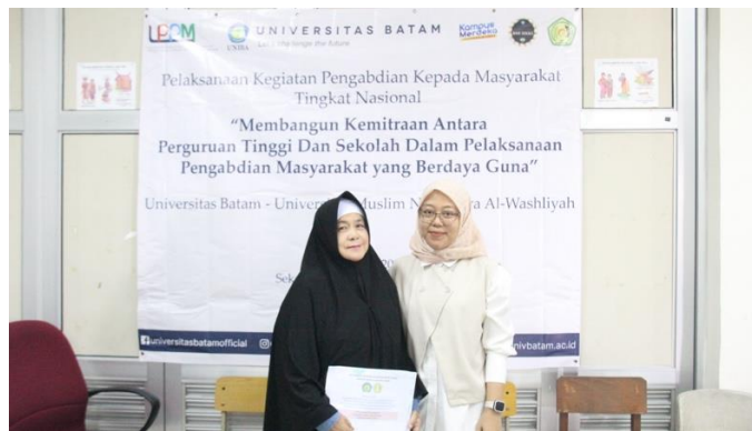
Gambar 3. Tim Kelompok 8