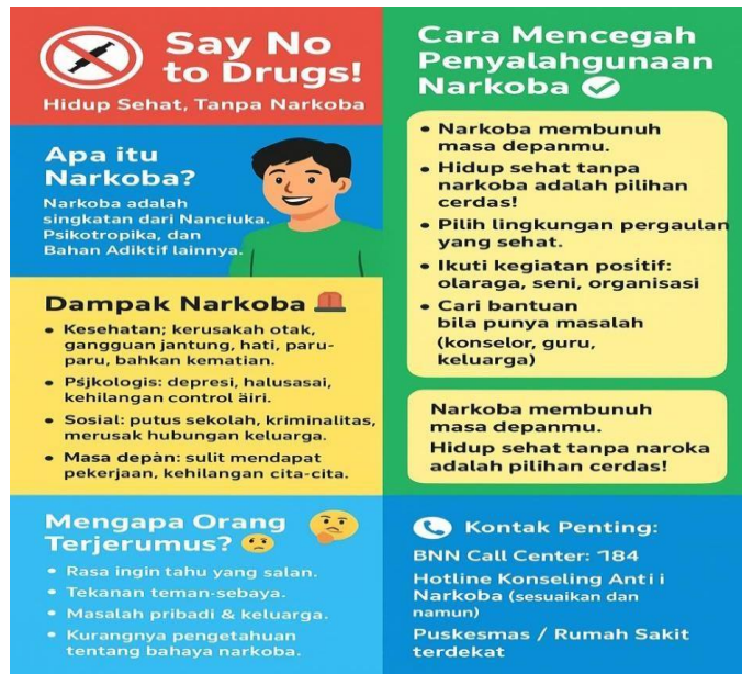
Gambar 1. Leaflet Edukasi