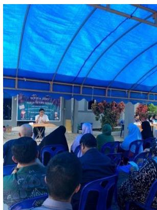
Gambar 1. Kegiatan Edukasi “Isi Piringku”