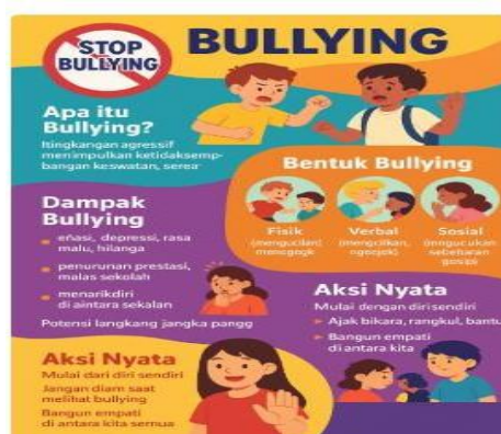
Gambar 1. Stop Bullying

Rekomendasi UNESCO (2020) bahwa sekolah harus menyediakan intervensi berbasis kebijakan, pendidikan karakter, dan sistem pelaporan aman untuk menurunkan angka bullying secara signifikan. Guru yang hadir menyampaikan bahwa pendekatan yang digunakan dalam program ini membantu memberi perspektif baru kepada siswa mengenai pentingnya empati dan komunikasi positif sebagai fondasi budaya sekolah yang peduli (caring school).