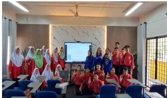
Gambar 2. Tim Kelompok 4

Dengan menggabungkan edukasi interaktif, pemutaran video, diskusi, dan refleksi sebagaimana ditunjukkan dalam materi kegiatan ini berhasil membentuk komitmen bersama di antara siswa untuk menghadirkan lingkungan sekolah yang lebih aman. Pendekatan "Be a Buddy, Not a Bully" terbukti efektif menumbuhkan nilai kebersamaan, dukungan sosial, dan kepedulian faktor-faktor yang menurut Rigby (2021) sangat berpengaruh dalam menurunkan perilaku bullying di sekolah. Dengan demikian, pembahasan ini menegaskan bahwa kegiatan PKM tidak hanya meningkatkan pengetahuan, tetapi juga membentuk sikap positif dan kesadaran kolektif dalam membangun sekolah yang peduli dan bebas bullying.